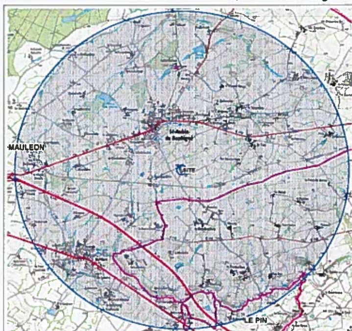
Carte rayon 3 km autour du site du Breuil

végétaux, d'effluents d'élevage, de matières stercoraires » de la réglementation ICPE pour une capacité de traitement de 5 tonnes/jour. Sur ce site est également présent un atelier de 55 vaches allaitantes et broutards, relevant du règlement sanitaire départemental (RSD).